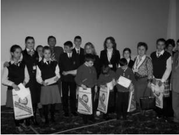
Resim yarışmasında ödül alanlar