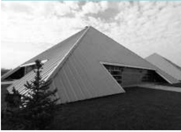
Eskim Makina'dan görüntüler