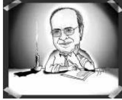
karikatür: Hilmet CERRAĞ

*Yaşama hakkı kadar eski, yaşama hakkı kadar kutsal başka bir şey yokken; gazetecilere, aydınlara, bilim insanlarına yönelik saldırının kaynağı da, yukarıda sözünü ettiğimiz 'kaynağın' hep aynı yere akması 'isteğindedir' ve kurulu olanın 'değişmesine' karşı nafil bir çabadır.