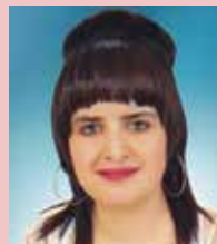
Naşide Akbaş BATMAN