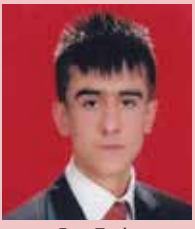
Fırat Tank AĞRI