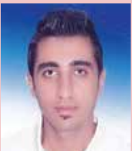
Eser Yazıl DİYARBAKIR