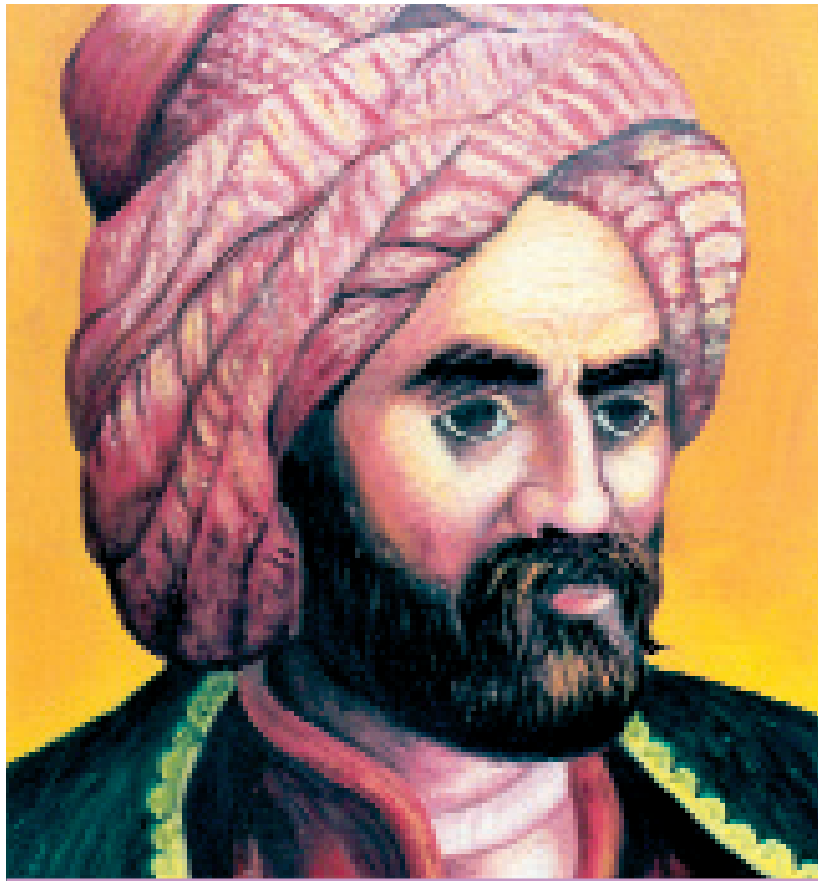
MIHEMED EMÎN TUMUR ENDEZYARÊ MAKÎNEYAN

Zimanê zikmakî ji bo gel wek nan û av û şîrê dayîkê ye. Ev mafekî xwezayî ye. Çawa ku di nav xwezayê de em nikarin ji şêrekî re bibejin "neçîrê neke û birçî bimîne". Ji bo mirov jî zimanê dayîkê bê qedexekirin heman tişt e. Qey em dikarin ji pisîkê re bibejin "avê venexwe", ji darên li nav serên çiya re bibejin "şîr nebin". Em nikarin vana bikin. Ya em ê şêr zincîr bikin ji bo neçîrê neke û ji bo dar şîr nebin jî divê çiya bîn şewitandin.