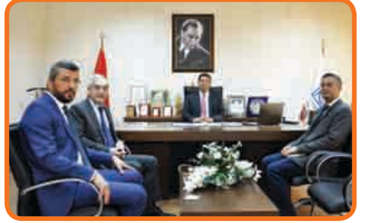
SÜ Sürekli Eğitim Merkezi ve İTÜ KKTC Yerleşkesi Müdürleri