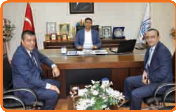
Bayır Otel Yetkilileri