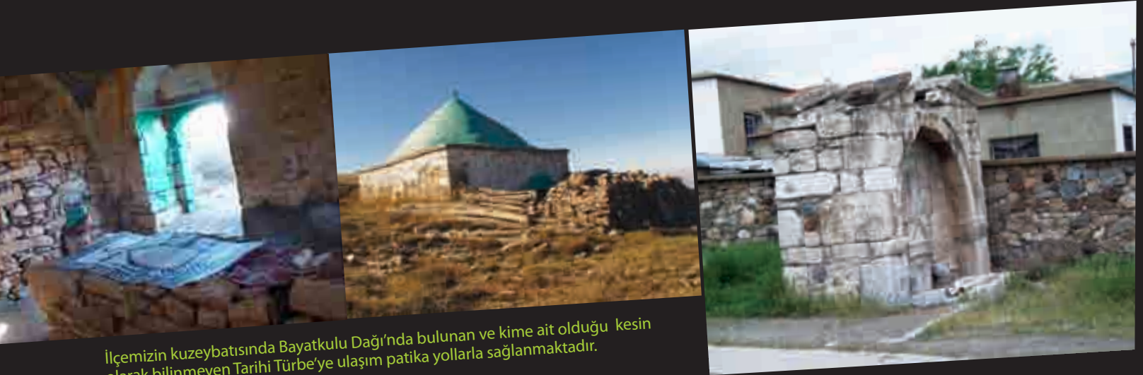
İlçemizin kuzeybatısında Bayatku Dağı'nda bulunan ve kime ait olduğu kesin olarak bilinmeyen Tarihi Türbe'ye ulaşım patika yollarla sağlanmaktadır.

Bu sülalelerin Yunak' ta yerleşmelerinden sonra çevre köylerden ve daha sonraları Emirdağ'dan buraya göçler olmuştur. Yörükler ise Antep, İslahiye, Antalya, Beyşehir yörelerinden yaklaşık 1870 yıllarında gelmişlerdir. Göçebeliliği terk ederek, yerleşik hayata geçmişlerdir. Özellikle Gökpınar'a 1949 yılında adı geçen yerlerden yerleşmeler olmuştur. Kargalı, Sıram, Ayrıtepe, Cebrail, Sevinç köyleri Sarıkeçili Yörükleri tarafından kurulmuştur.