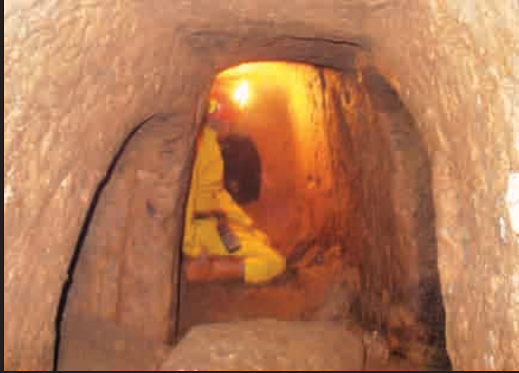
• Karataş Mahallesi'nde Turogluları'na ait bahçe içinde bir başka mağara.

İlçenin kuzeybatı yönünde 2 km mesafedeki Hacı İbrahim Dağı adıyla bilinen bir tepenin yanı başında " Bayramın Hazine İni Ma arası " mevcuttur. Yapılan araştırmalar, bu mağaranın eski devirlerde maden ocağı olarak çalıştırıldığı anlaşılmaktadır. Yine, ilçenin eteğinde kurulduğu Bayatkolü dağının doğusuna bakan yönünde " Yallı Ma arası " isminde dibi bulunmayan bir taş mağara mevcuttur. Dağın ismi Bayat aşiretinin bir kolu tarafından verilmiştir. Dağın kuzey yamacını günümüzden yaklaşık 500 yıl kadar önce yurt tutmuş olan bu kolun zaman içerisinde dağıldığı veya başka yelere göç ettikleri anlaşılmaktadır.