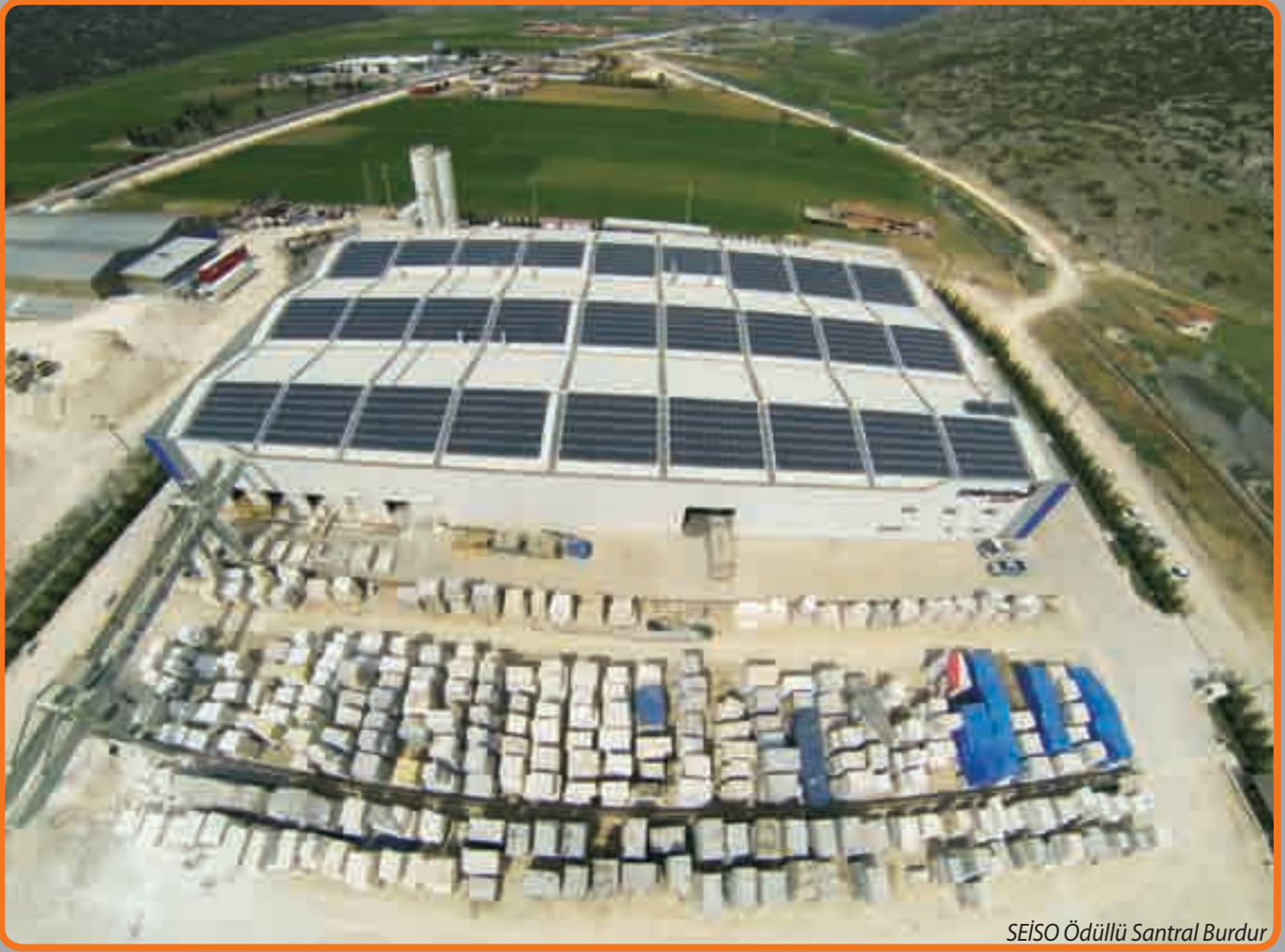
SEİSO Ödüllü Santral Burdur

2015 yılından itibaren daha "inovatif" projelere odaklanan SEİSO, aynı yıl geliştirerek devreye aldığı "Antalya Stadi Güneş Santrali Projesi" "Dünyanın En Büyük Güneş Enerjili Spor Tesisi" unvanı elde etti. Tesis Katar'da 2016 yılında düzenlenen "World Stadium Congress" isimli kongrede "En İnovatif Stadyum" ödülüne aday gösterildi. Türkiye'de spor