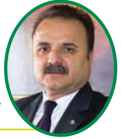
Hazırlayan: Doç. Dr. Nuri ŞİMŞEKLER Selçuk Üniversitesi

Bu sözleri işitip yaptığı icraatların muhasebesini yapan sultan, ağlayarak dışarı çıkar ve Allah'a dualarda bulunarak daima âdil olacağına ve iyi işler yapmaya dair yemin eder.