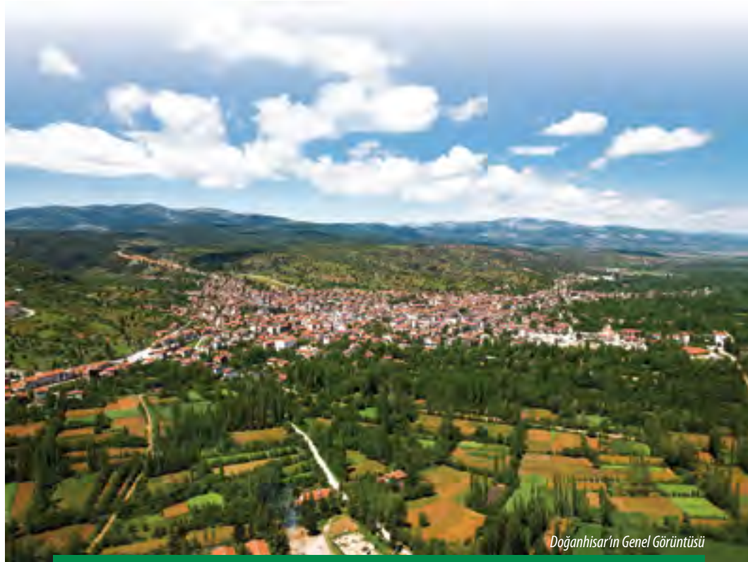
Doğanhisar'ın Genel Görüntüsü

Doğanhisar'ın kuruluşu Roma-Bizans dönemine dayanır. Bunu, yapılan çeşitli kazılarda çıkan tarihi eserlerden ve kitabelerden anlamaktayız. Bugüne kadar bulunan yazılı taş, heykel, lahit gibi eserlerin çoğu Konya ve Akşehir Arkeoloji Müzelerinde, birçoğu da Doğanhisar' da açık alanlarda sergilenmektedir.