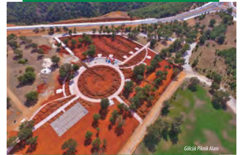
Gölcük Piknik Alanı