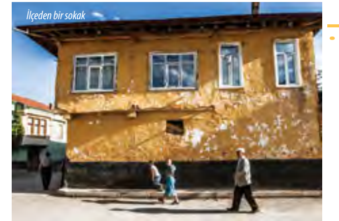
İlçeden bir sokak