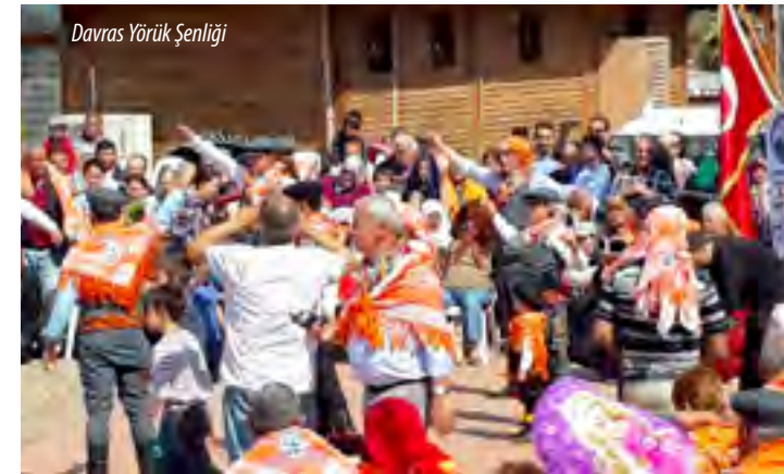
Davras Yörük Şenliği