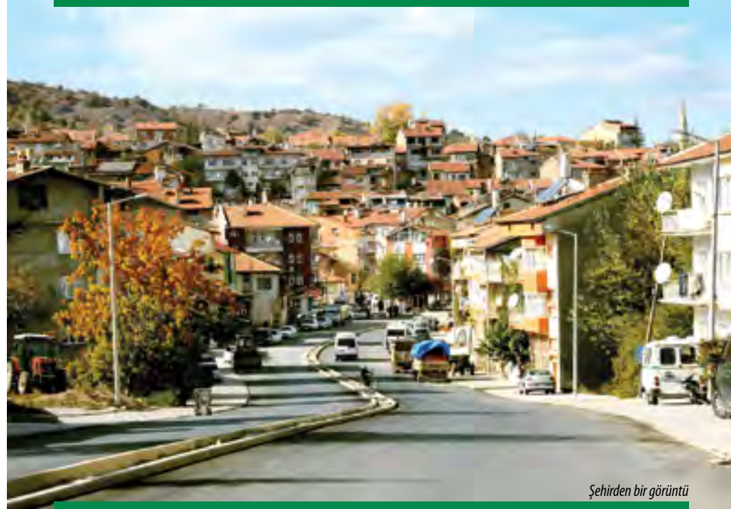
Şehirden bir görüntü

İlçe ekonomisi tarım ve Hayvancılığa dayalıdır. Tarım alanlarında hububat, baklagiller, sebze ve meyve bitkileri üretilmektedir. Sanayi geliri ve sanayileşme yok denecek kadar azdır. İlçenin genel alanı 56.344 hektardır. Bununun 20.897 hektarı ekilebilir tarım arazisi, 9.286 hektarı çayır ve mera, 21.150 hektarı orman arazisidir. 1.100 hektarı göl, baraj, yerleşim yeri ve 3.661 hektar kullanılmayan arazidir. Ekilebilir 20.897 hektar tarım arazisinin 4.730 hektarı akarsu, gölet ve yer altı suları ile sulanabilir ve 16.167 hektarı ise sulanamayan arazidir. İlçenin Kasaba ve Köylerinde yapımı devam eden göletlerin tamamlanması ile sulanabilir arazi