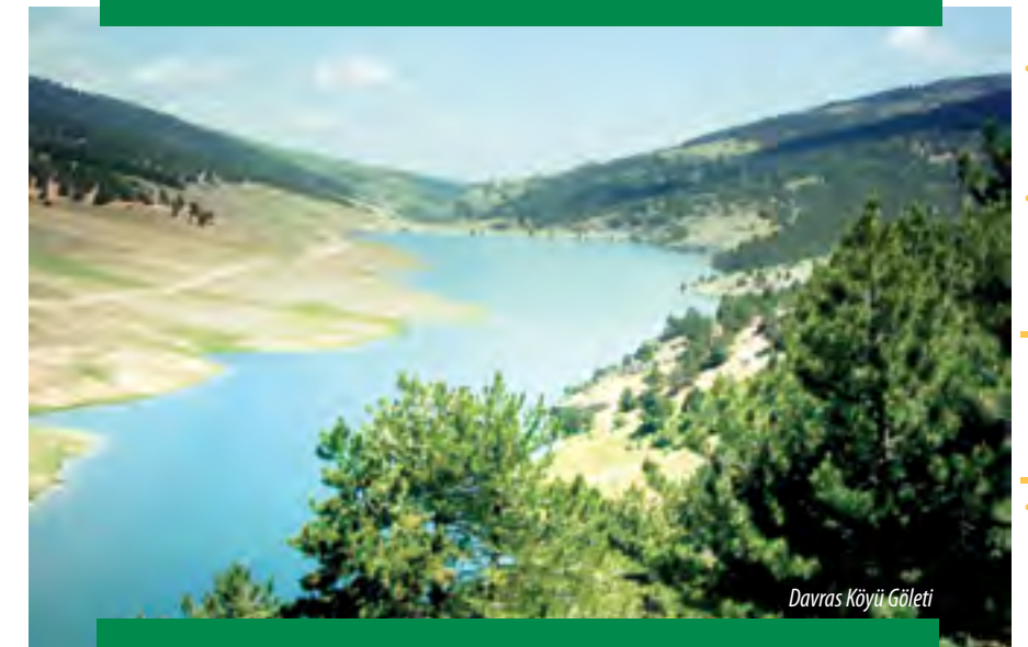
Davras Köyü Gölü

Malazgirt Savaşı sonrası Selçukluların batıya yayılışları sırasında 1110 yılında Doğanhisar Türk hakimiyetine geçmiştir. Şehrin adı Selçukluların arasında DOĞAN kuşuna izafeten "DOĞAN KALESİ" olarak değiştirilmiştir.