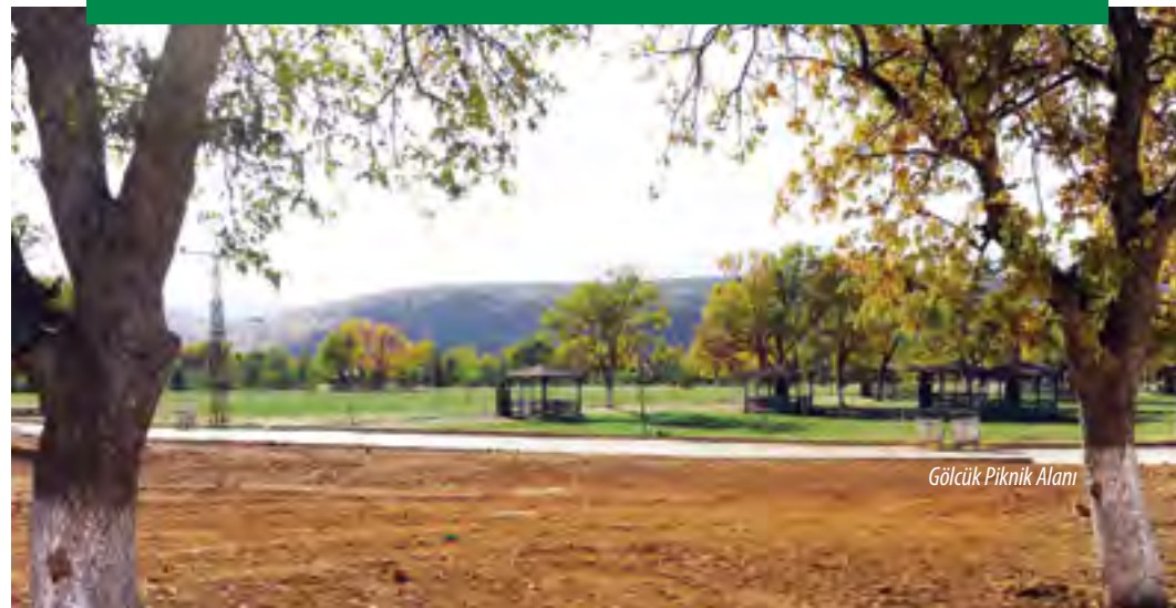
Gölçük Piknik Alanı

Tarım geliri olarak vişneciliğin son yıllarda oldukça arttığı görülmektedir. Son zamanlarda elma yetiştiriciliği de gelişmektedir. İlçede Hayvancılık önemli bir gelir kaynağı durumdadır, ancak son yıllarda azalma görülmektedir. İlçe genelinde 2800 adet koyun 150 adet keçi olmak üzere 2850 adet küçükbaş hayvan ile 4800 adet büyükbaş hayvan, 14 000 adet kümes hayvanı, 1850 adet Arı kovanı, 185 adet At, 98 adet Katır ve 1210 baş Eşek bulunmaktadır. Tarımda ve taşımada at, eşek gibi hayvanlardan da yararlandığı görülmekte olup, tarımda