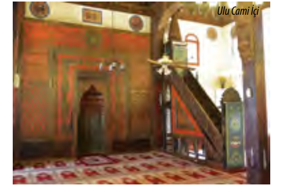
Ulu Cami İçi