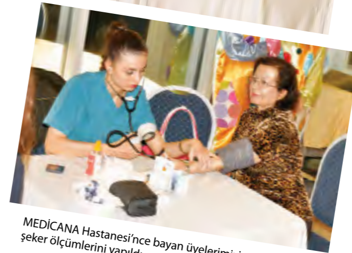
MEDİCANA Hastanesi'nce bayan üyelerimizin tansiyon ve şeker ölçümlerini yapıldı.