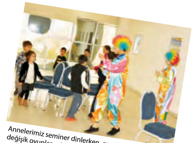
Annelerimiz seminer dinlerken, çocuklar da palyaçolarla değişik oyunlar eşliğinde eğlenceli vakit geçirdiler.